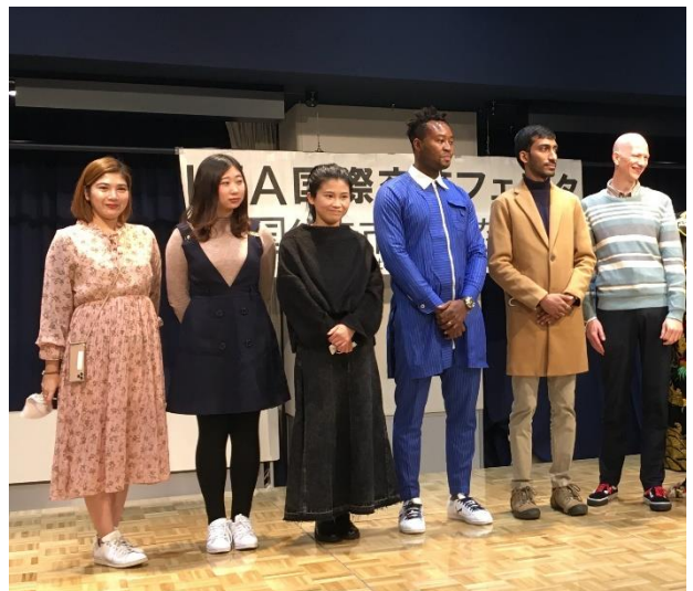
2022年11月20日 国際交流フェスタ