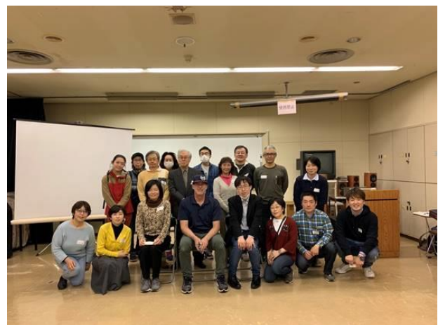
4月16日「ウェルカムサロン」の様子

国分寺駅北口のアクティ・ココブンジにて参加者同士の交流を行った後、国分寺史跡に移動し桜のライトアップを鑑賞しました。